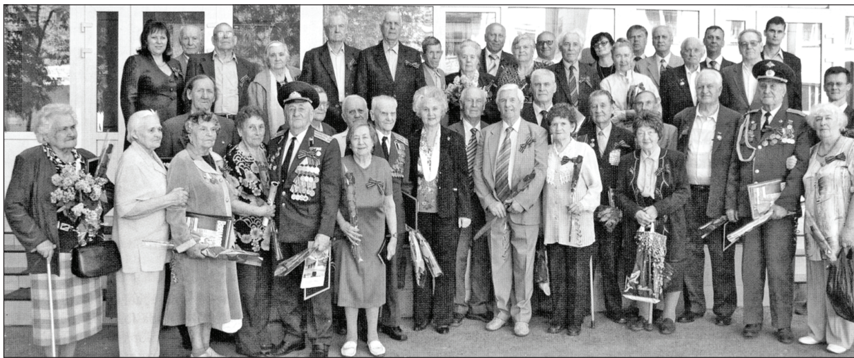
ВЕТЕРАНЫ САРАТОВСКОГО ГОСУДАРСТВЕННОГО АГРАРНОГО УНИВЕРСИТЕТА

САРАТОВЦЫ — ВЕТЕРАНЫ ТРУДОВОГО ФРОНТА ВЕЛИКОЙ ОТЕЧЕСТВЕННОЙ ВОЙНЫ 1941-1945 гг.